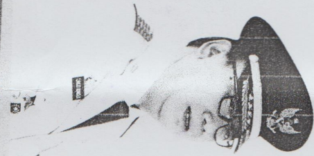
Tjahjo Kumolo MENTERI DALAM NEGERI REPUBLIK INDONESIA